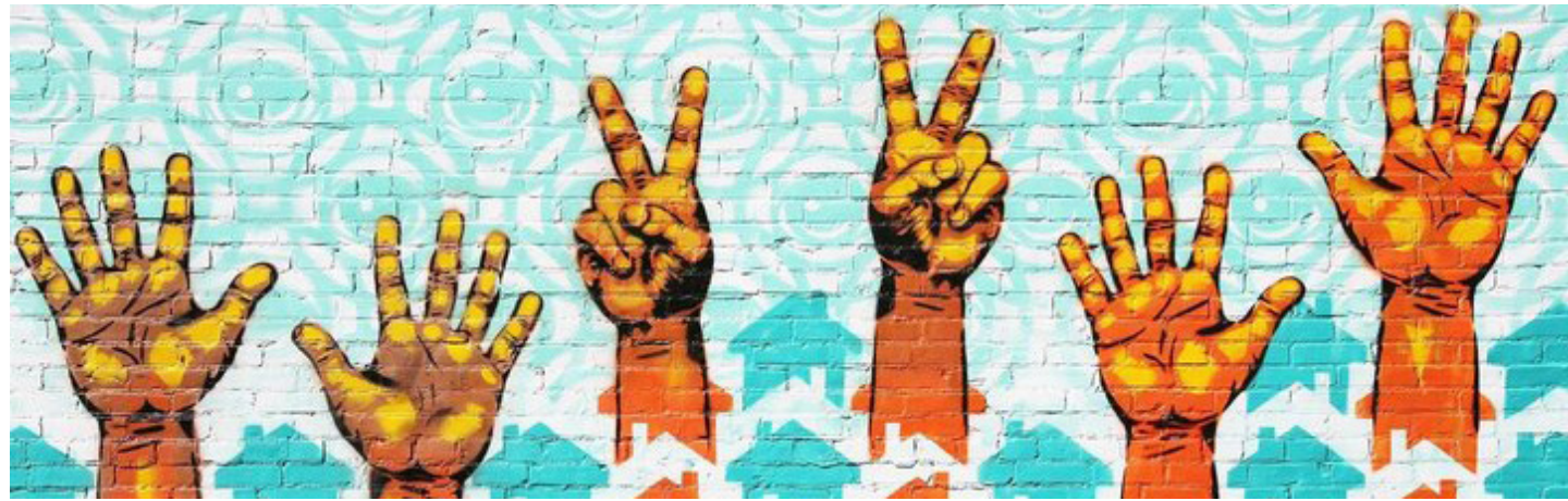
Hands Up for Peace, Street Art Missouri, USA/Creative Common

Die Stärke der KOFF Plattform ist das breite Spektrum an Expertisen, Erfahrungen und Perspektiven ihrer Mitglieder in der Schweiz und deren Partner:innen im Ausland. Diese Kompetenzen bilden die Grundlage für die friedenspolitische Arbeit von KOFF (Policy) und für die Entwicklung von Strategien und Ansätzen der zivilen Friedensförderung (Praxis).